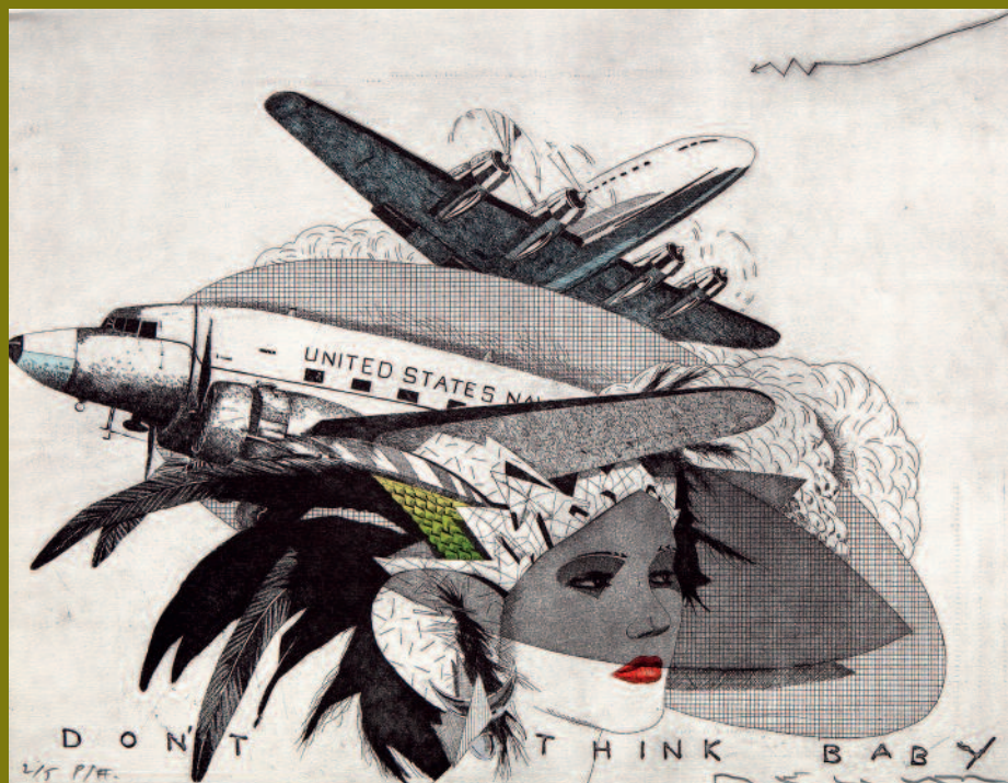
Don't think, baby (aviones) , 1989

Aguafuertes históricos de la serie Don't think, baby (Sombreros) , de 1989