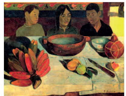
Gauguin, Le repas / Les bananes, 1891