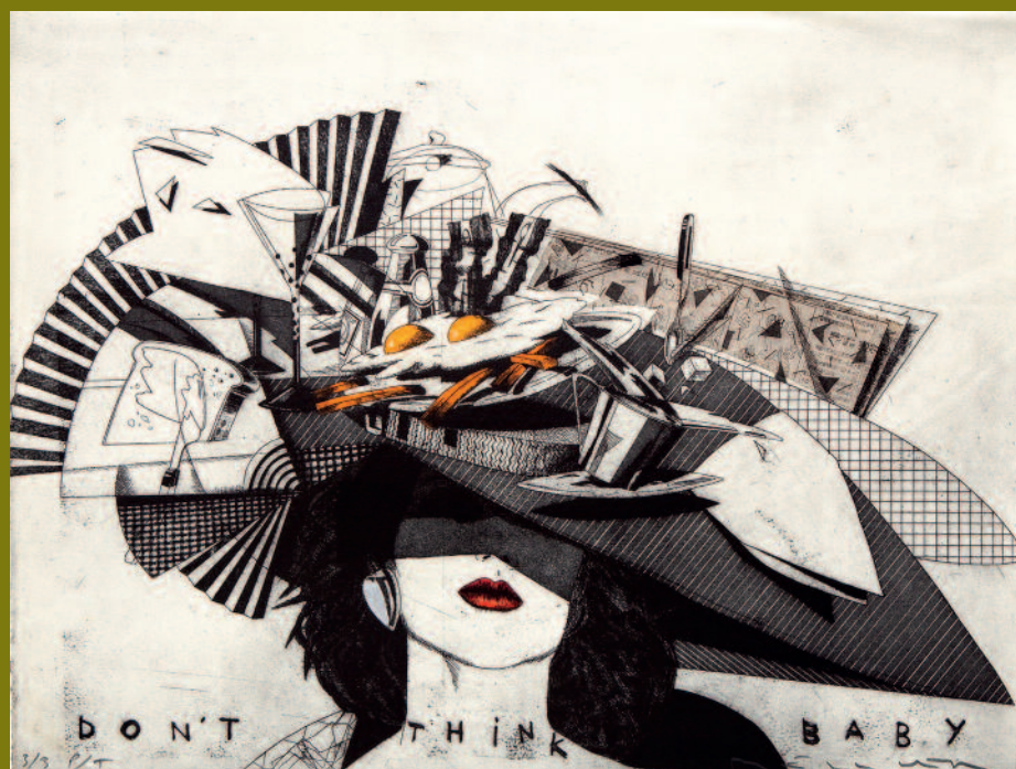
Don't think, baby (Sombreros) , 1989

Aguafuerte, aguatinta y collage iluminado a mano