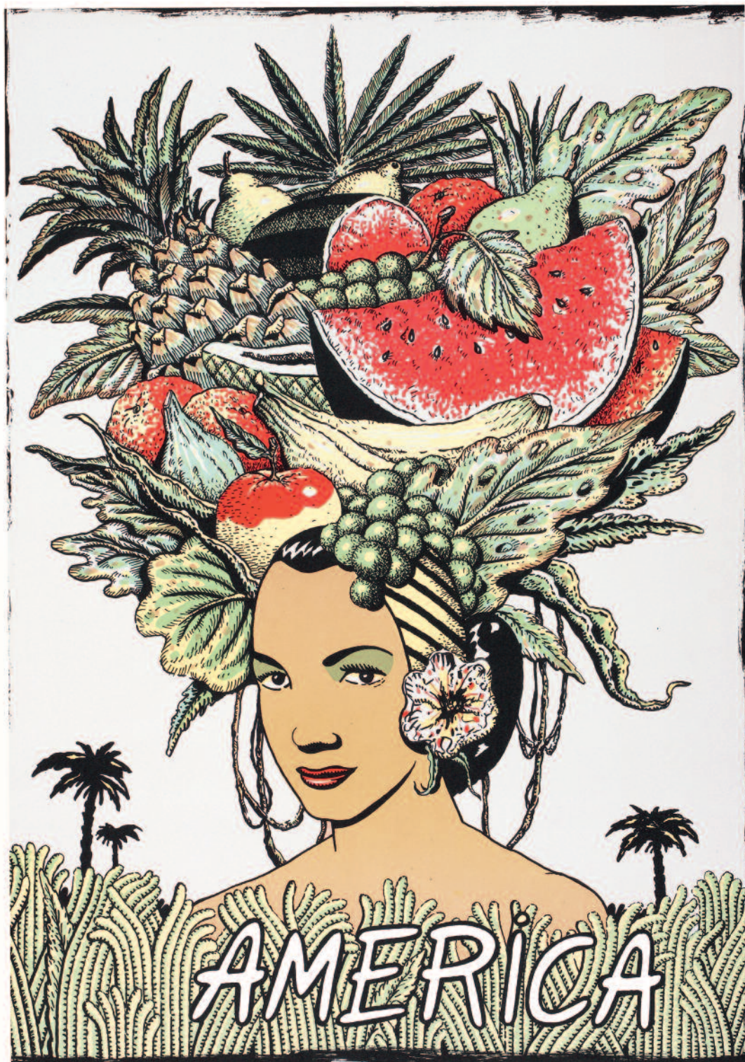
América. Serie Cinco Continentes. N° de pedido: 40571