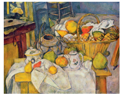
Cézanne, Bodegón con cesta de frutas, 1888-90

Las bellísimas imágenes en los templos y tumbas de la Antigüedad egipcia ofrecen escenas relacionadas con la comida y con las ofrendas a los muertos. En ellas –como en los decorados sobre jarras de la Antigua Grecia, en las pinturas murales de la Roma clásica o en los mosaicos de Pompeya– encontramos composiciones precursoras de los grandes bodegones y cuadros de siglos posteriores. A lo largo del siglo XX –desde Gauguin y Cézanne , pasando por Picasso , Matisse , Braque y Juan Gris , hasta Roy Lichtenstein y los maestros del pop art – la comida y los temas culinarios han tenido una presencia constante en el arte. Piezas representativas del feliz maridaje de arte y comida las encontramos hoy en las pinacotecas del mundo, en los salones de selectos hoteles y restaurantes y en los espacios más acogedores de viviendas y oficinas.