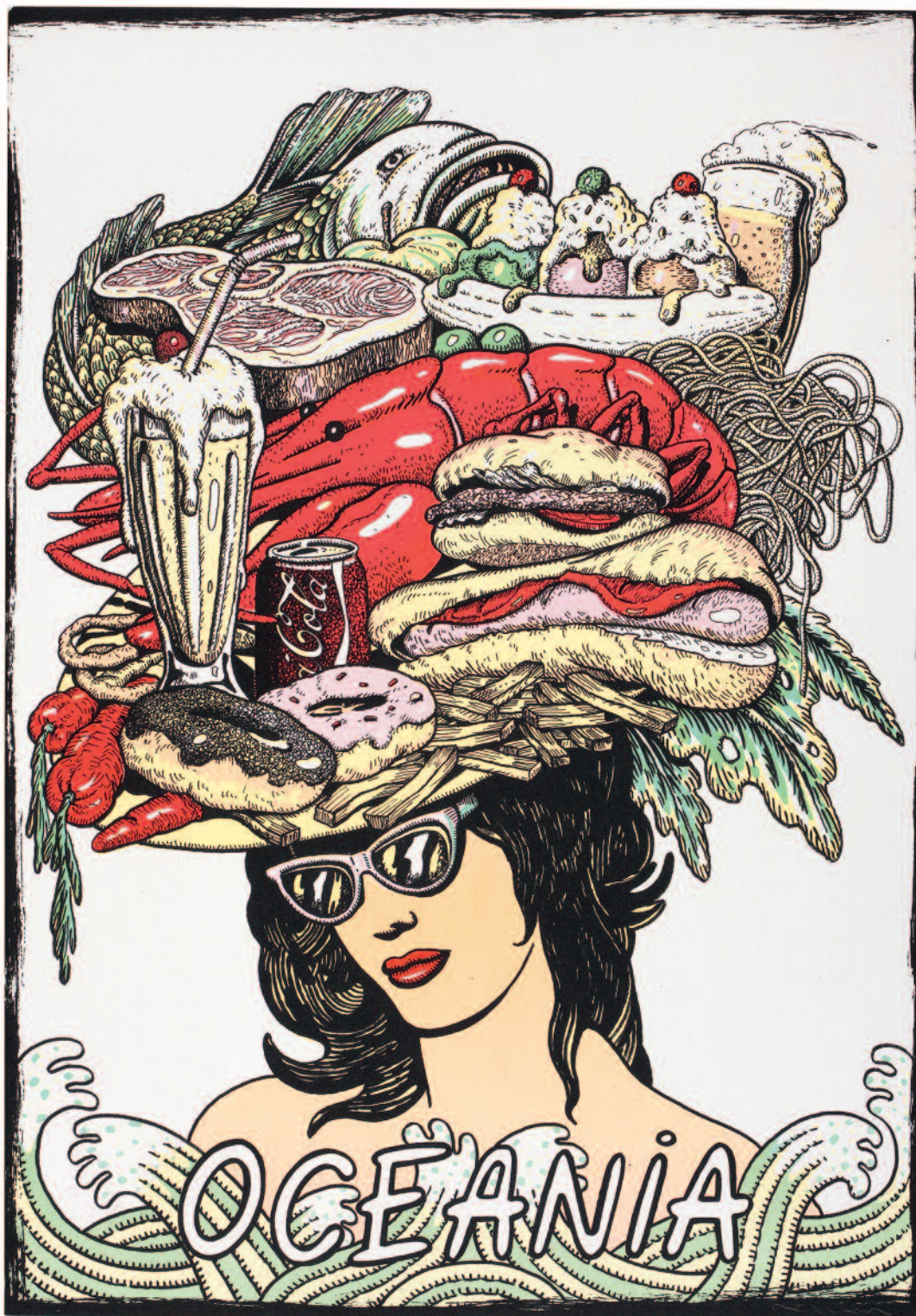
Oceanía. Serie Cinco Continentes. N° de pedido: 40573