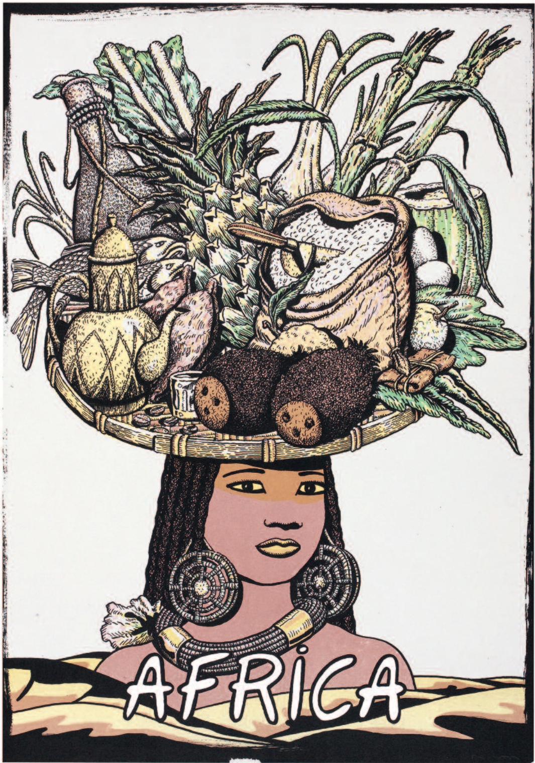
África. Serie Cinco Continentes. N° de pedido: 40572