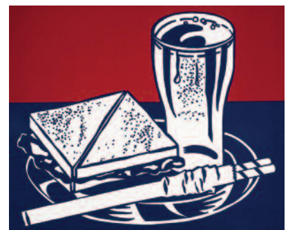
Roy Lichtenstein, Sandwich and Soda, 1964