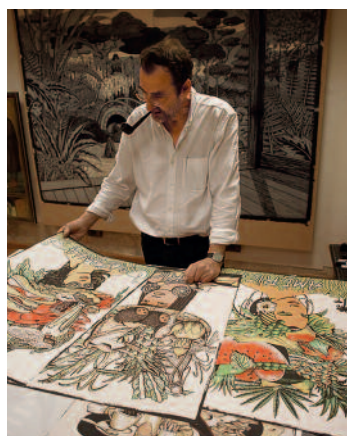
Bellver en la última revisión de la edición antes de su entrega a Círculo del Arte.

Conscientes del difícil momento económico y fieles al compromiso del club con sus socios, hemos apurado al máximo