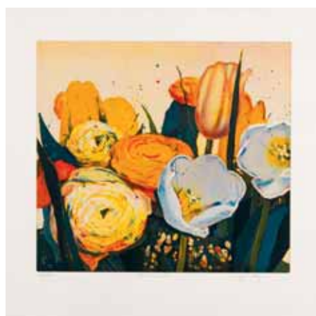
Gerhard Hofmann Ramo en amarillo, 2006

Precio con iva: Básico: 500,00 € Cuota A: 475,00 € Cuota B: 450,00 € Cuota C: 400,00 €