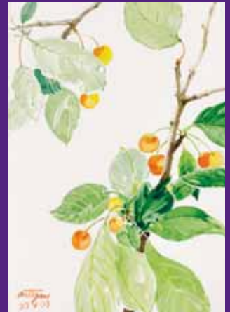
Cerezas, Osona. Mayo 2009. N° de pedido: 40118