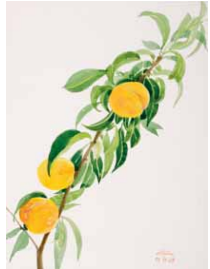
Melocotones, Osona. Septiembre 2009. N° de pedido: 40104