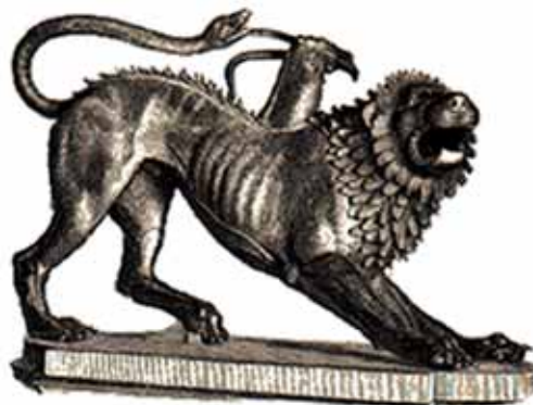
Quimera de Arezzo Museo del Bargello, Florencia

Así nació mi ciclo Los tiempos de la naturaleza . Todos los motivos que me sirvieron de modelo se consumirán o desaparecerán, y así irán cumpliendo sus ciclos. Si durante el proceso consigo captar un momento irrepetible, me daré por satisfecho, más aún, si alguien siente ante mi trabajo algo de lo que yo experimenté ante La quimera de Arezzo .