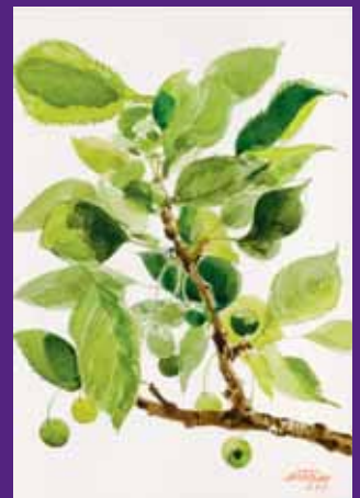
Cerezas verdes, Osona 2009. N° de pedido: 40122