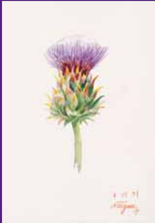
Alcachofa silvestre, Matarranya. Julio 2009. N° de pedido: 40144