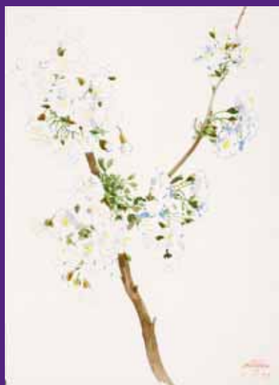
Flor de cerezo, Menorca. Abril 2009. N° de pedido: 40113