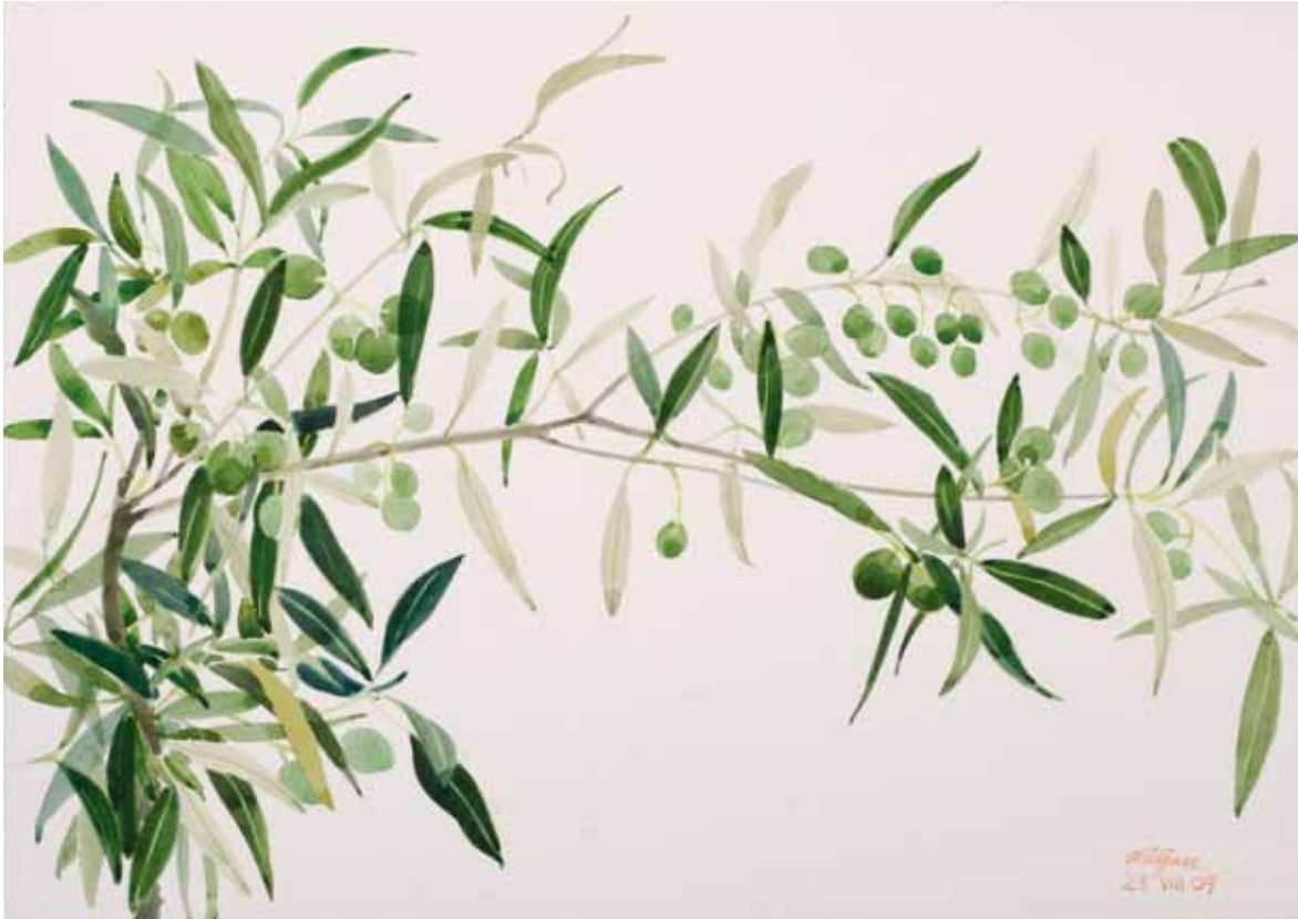
Olivas verdes, Menorca. Agosto 2009. N° de pedido: 40100