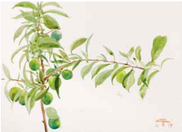
Ciruelas, Menorca. Junio 2009. N° de pedido: 40117