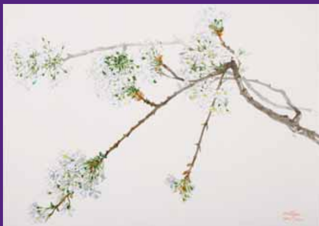
Flores de cerezo, Menorca. Abril 2010. N° de pedido: 40097