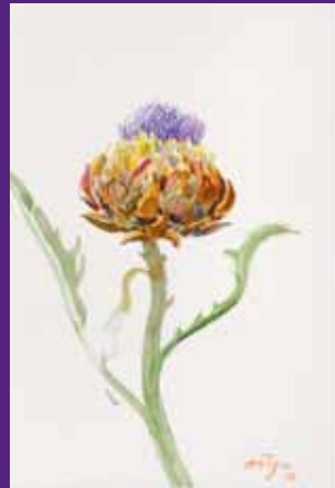
Flor de alcachofa, Barcelona 2009. N° de pedido: 40143