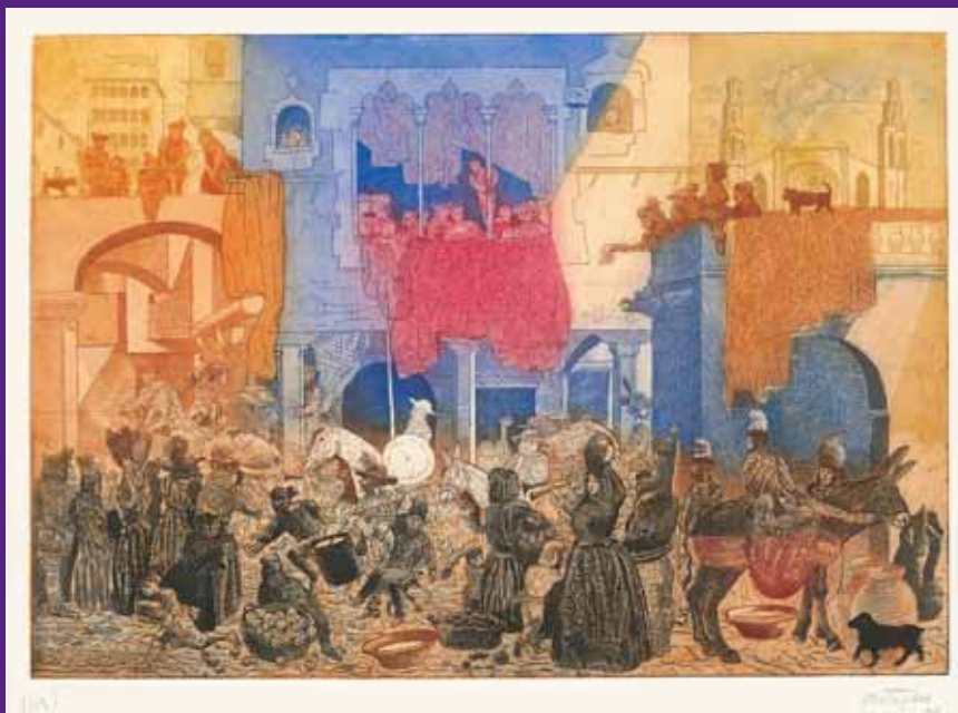
Francesc Artigau Entrada de Don Quijote en Barcelona, 2005. N° de pedido: 18689

Aguafuertes en 11 colores Formato: 39 x 56 cm Papel: Arches 56 x 76 cm Edición de 75 ejemplares numerados y firmados