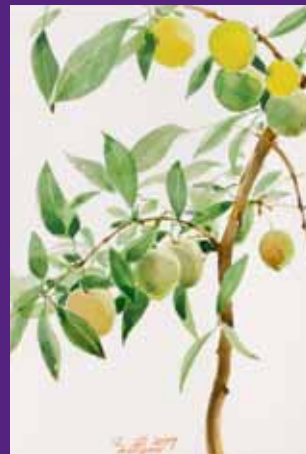
Ciruelas, Menorca. Julio 2009. N° de pedido: 40123