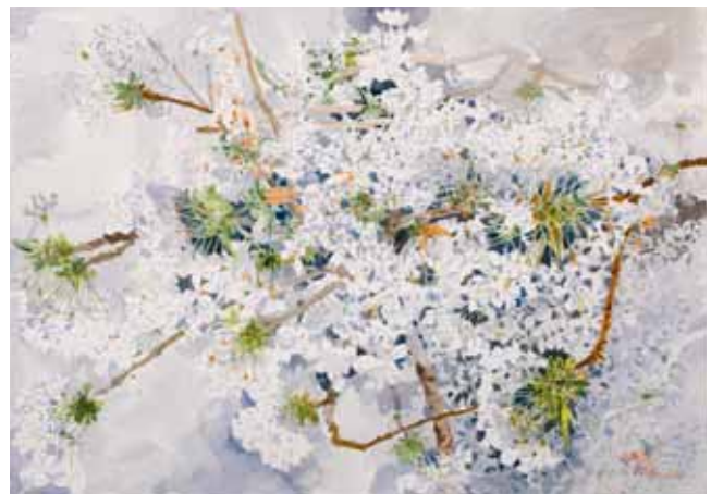
Flores de cerezo, Menorca. Abril 2010. N° de pedido: 40102

Acuarelas Formato: 47 x 62 cm Precio con IVA por ejemplar: Básico: 1.500,00 € Cuota A: 1.425,00 € Cuota B: 1.350,00 € Cuota C: 1.200,00 €