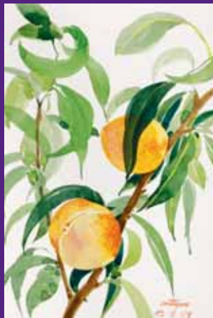
Melocotones, Osona. Septiembre 2009. N° de pedido: 40120