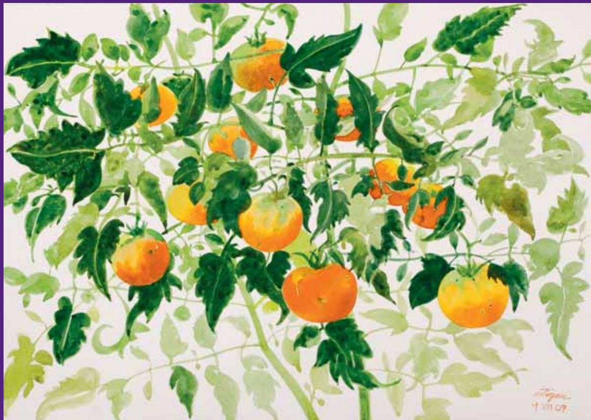
Tomates, Menorca. Agosto 2009. N° de pedido: 40099

Acuarelas de la serie Los tiempos de la naturaleza