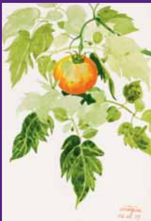
Tomate, Menorca. Agosto 2009. N° de pedido: 40119