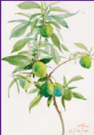
Ciruelas verdes, Osona. Junio 2009. N° de pedido: 40150