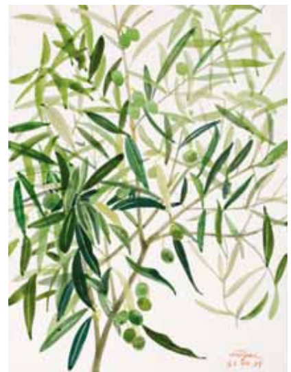
Olivas verdes, Menorca. Agosto 2009. N° de pedido: 40142