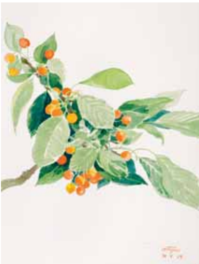
Cerezas, Osona. Mayo 2009. N° de pedido: 40106