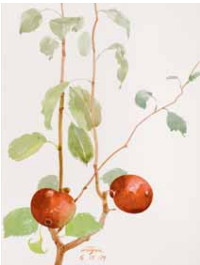
Belleza de Roma, Osona. Septiembre 2009. N° de pedido: 40115