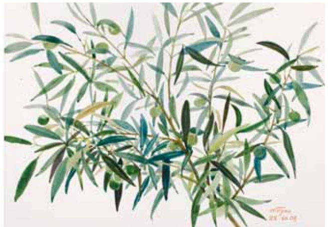
Olivas verdes, Menorca. Agosto 2009. N° de pedido: 40107