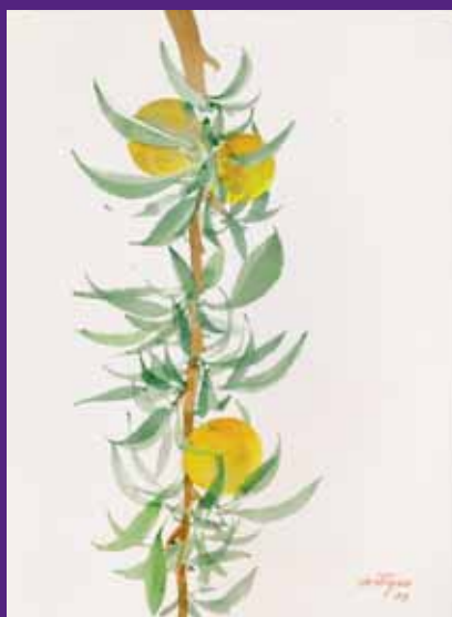
Ciruelas, Menorca 2008. N° de pedido: 40116