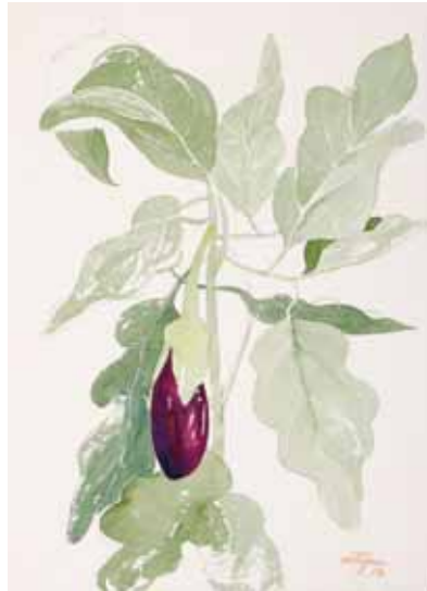
Berenjena, Menorca 2008. N° de pedido: 40103