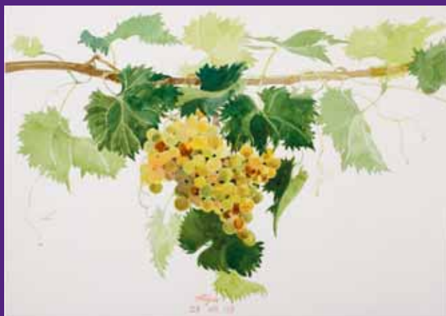
Uva de parra, Menorca. Agosto 2009. N° de pedido: 40098