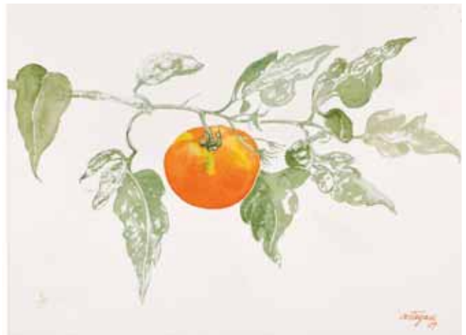
Tomate, Menorca 2009. N° de pedido: 40110