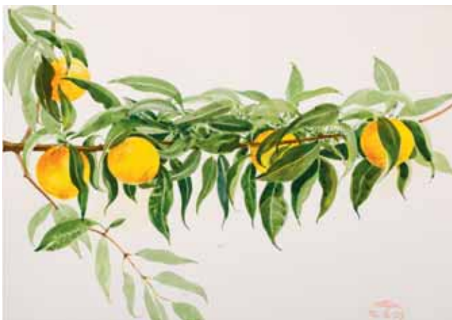
Melocotones, Osona. Septiembre 2009. N° de pedido: 40101