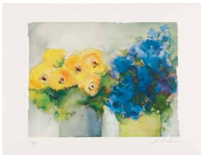
Christine Krembau Begonias, 2004

Precio club: 325,00 € Precio P&D: 180,00 € + 250 Puntos