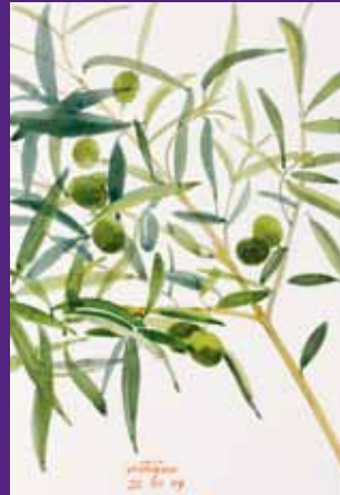
Olivas verdes, Menorca. Agosto 2009. N° de pedido: 40149