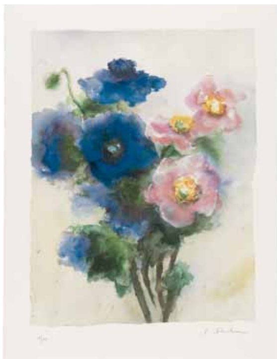
Christine Krembau Anémonas, 2003

Litografía Formato de imagen: 57 x 43,5 cm Papel: Zerkall-Bütten 70 x 53,5 cm Edición de 90 ejemplares numerados y firmados N° de pedido: 28837