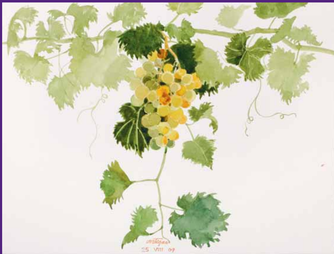
Uva de parra, Menorca. Agosto 2009 N° de pedido: 40109