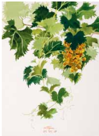
Uvas de parra, Menorca. Agosto 2009. N° de pedido: 40105