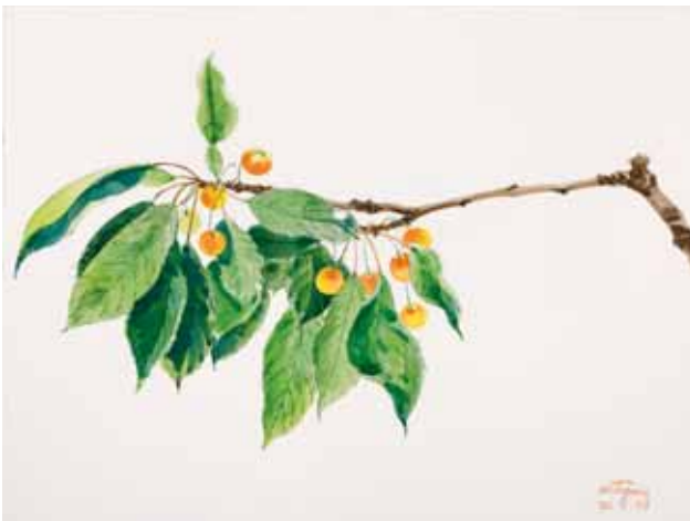
Cerezas, Osona. Mayo 2009. N° de pedido: 40108