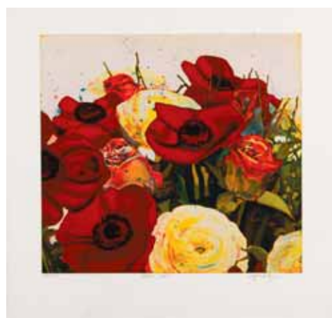
Gerhard Hofmann Flores en rojo, 2006

Precio club: 325,00 € Precio P&D: 180,00 € + 250 Puntos