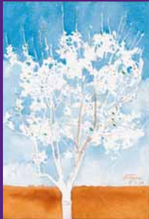
Cerezo en flor, Menorca. Abril 2009. N° de pedido: 40146