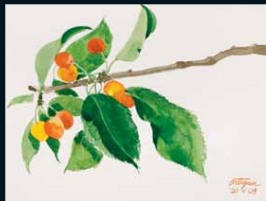
Cerezas, Osona. Mayo 2009. N° de pedido: 40148