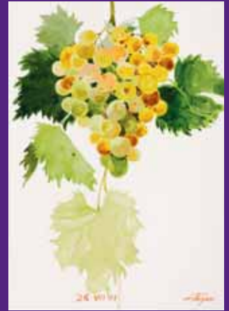
Moscatel, Menorca. Agosto 2009. N° de pedido: 40147