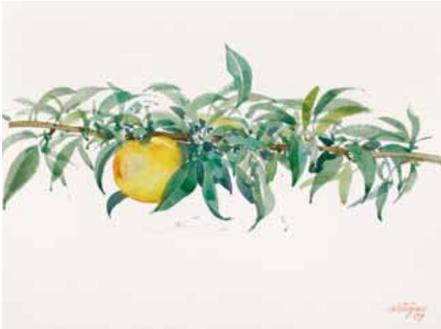
Melocotón, Osona 2009. N° de pedido: 40139