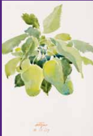
Manzana del Cirio, Osona. 2009. N° de pedido: 40145