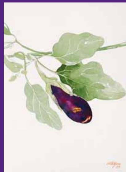
Berenjena, Menorca 2009. N° de pedido: 40111