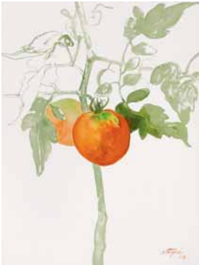
Tomates, Menorca 2008. N° de pedido: 40141