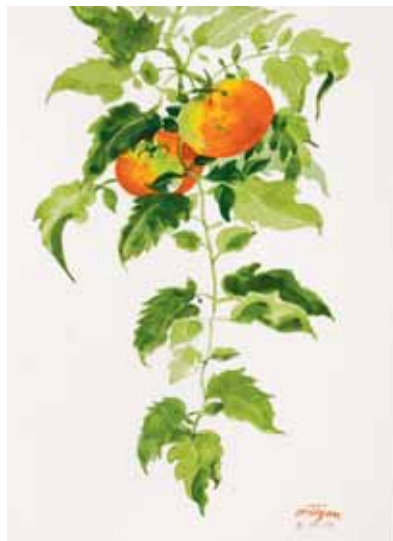
Tomates, Menorca. Agosto 2009. N° de pedido: 40114