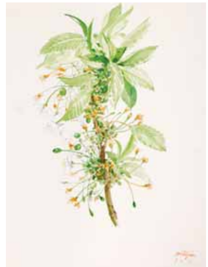
Brotos de cerezo, Menorca. Abril 2009. N° de pedido: 40112