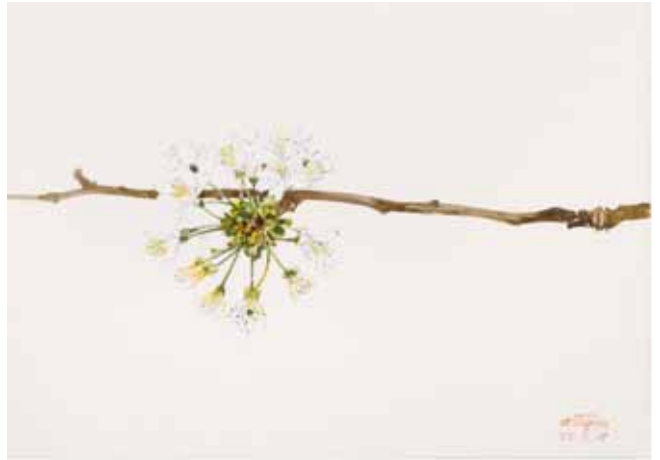
Brotos de cerezo, Osona. Abril 2009. N° de pedido: 40140